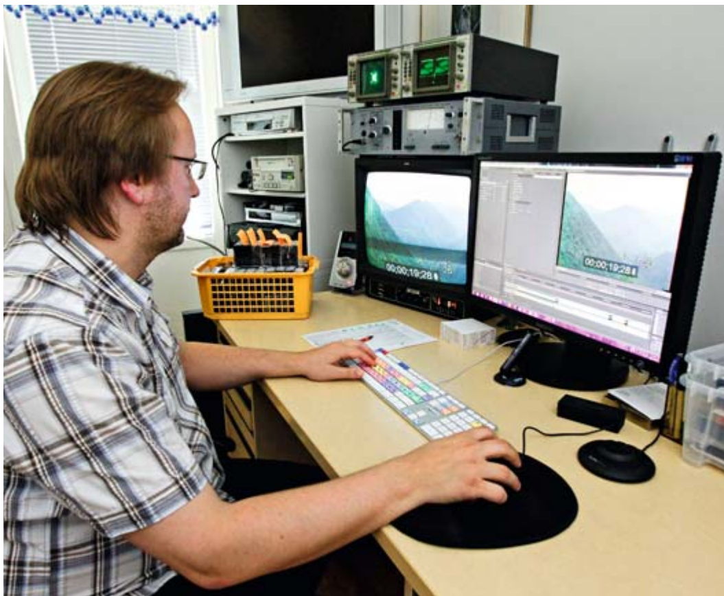
DIGITOINTITYÖPISTEESSÄ tarvitaan raskasta tietokonekalustoa ja videomittalaitteistoa. Taustalla näkyy digitoinnissa välttämätön videonauhurivalikoima.

Suurin osa yrityksen asiakkaiden kaseteista on vhs- tai vhs-c-tyyppiä. Työläimpiä digitoitavia kasetteja ovat Video8- ja Hi8-kasetit, joiden toistoon alkuperäinen kameranauhuri olisi suositeltavin. Ongelmat johtuvat nauhaohjainten säätövirheistä. Filmimateriaalien digitointi ei kuulu DigiOmmel-yhtiön omiin työsuorituksiin, joten yritys teettää filmisiirrot englantilaisella yrityksellä. LII